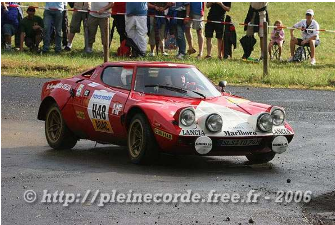
Eifel Historic Rallye 2006, entry number 48, retired/accident